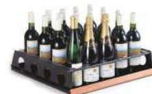
מדף טעימות נשלף