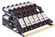
מדף תצוגה נשלף